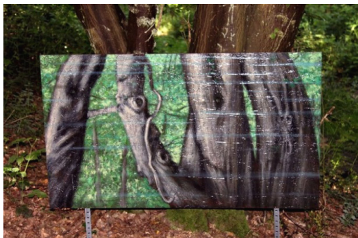
«Réflexion sur la nature»