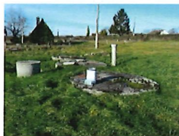
Ouvrages de la station