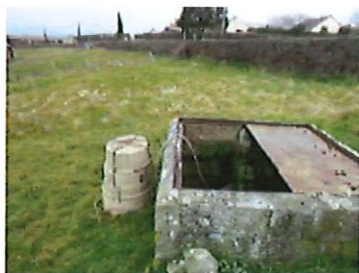
Regard avant station

Cette opération est inscrite dans le programme pluriannuel d'investissement de l'Intercom Bernay Terres de Normandie.