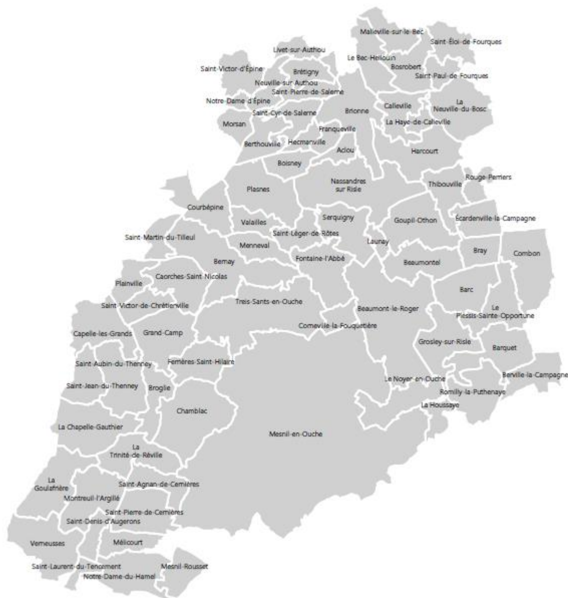
Carte du territoire desservi