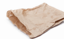
Tous les emballages en carton