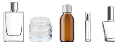
Flacons et autres... (crème de soins, parfum, sirop...)