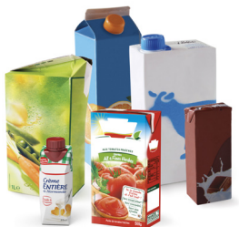
Briques alimentaires, sacs et films, emballages métalliques