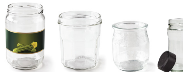
Pots (légumes, confiture, yaourt, épices)