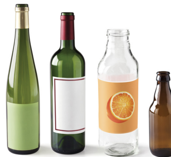
Bouteilles, canettes et bocaux