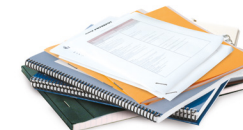
Cahiers, bloc-notes et impressions