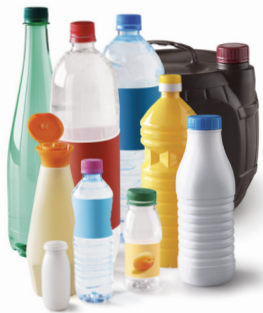
Bouteilles, bidons et flacons en plastique