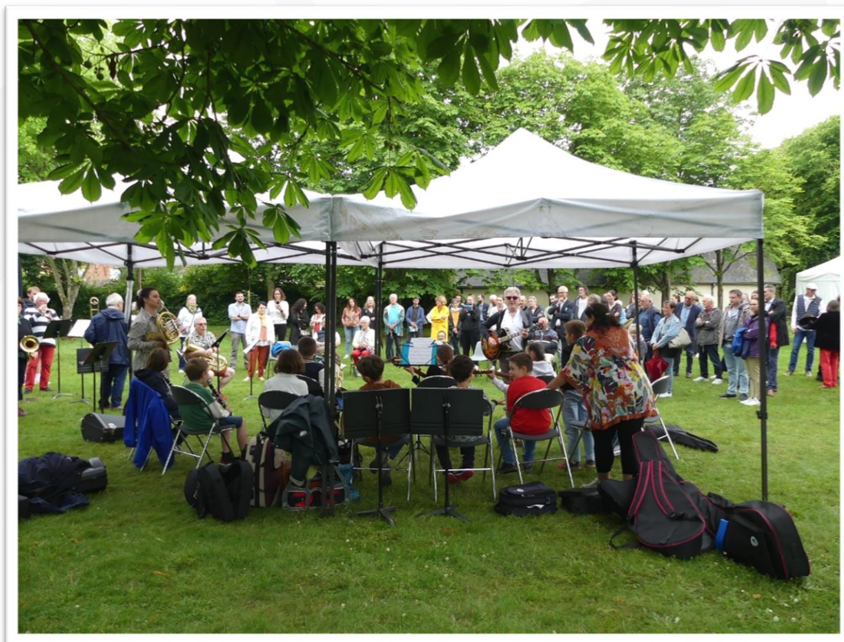
Photo de l'inauguration du Sentier d'art 2024 à Beamesnil